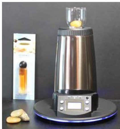
Afb. 2: Etherische olie diffuser

Etherische oliën zijn vloeibare geurstoffen van planten, geschikt voor aromatherapie. In en op de plant komen ze voor als minuscuul kleine druppeltjes olie. Het zijn heel vluchtige stoffen, de samenstelling is niet te vergelijken met plantaardige oliën zoals amandel- of zonnebloemolie. Etherische olie lost slecht op in water, maar heel goed in vette olie of alcohol met een hoog percentage.