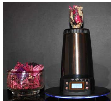
Afb. 3: Kruiden verdampen in een vaporizer

Geschikte kruiden en etherische oliën om te verdampen in een vaporizer kun je in allerlei reform- en natuurvoedingswinkels kopen. Ook Dutch-Headshop.com heeft in het Smartshop gedeelte diverse kruiden die geschikt zijn om te verdampen in een vaporizer. Sommige kruiden geven een aangename aromatische ervaring, andere staan weer bekend om medicinale of milde psychoactieve effecten. Een aantal planten kennen we als tuinplant wat de mogelijkheid geeft om je eigen kruiden te kweken en te oogsten voor je eigen aromatherapie.